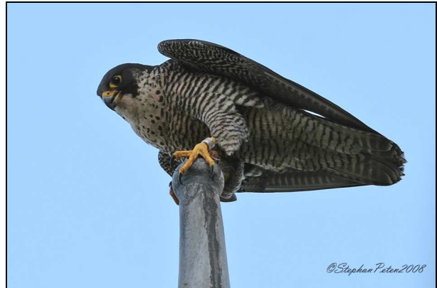
Faucon pèlerin mâle (église Saint-Hubert à Boitsfort)

Mais la bonne nouvelle, après cette longue attente, est que sept fauconneaux ont vu le jour cette année sur l'ensemble de la Région de Bruxelles-Capitale. A savoir : trois jeunes à Watermael-Boitsfort et quatre à Bruxelles-Ville (cathédrale des Saints Michel et Gudule).