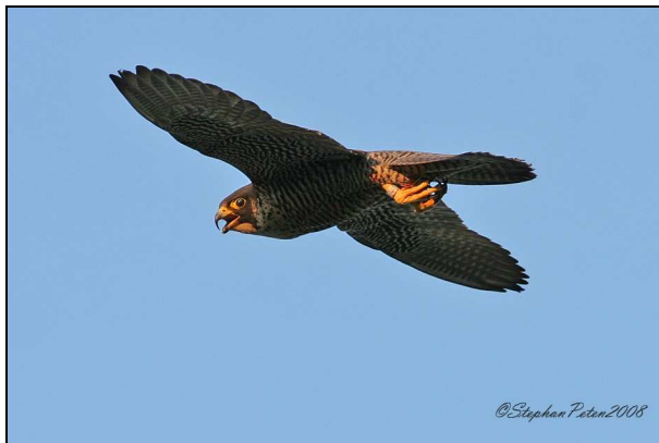
Faucon pèlerin femelle en vol (église Saint-Hubert à Boitsfort)

Ces deux formidables couvées sont sorties des nichoirs depuis la mi-mai. Les fauconneaux rodent dans les environs de Bruxelles, et donc sur nos sites, en quête de proies.