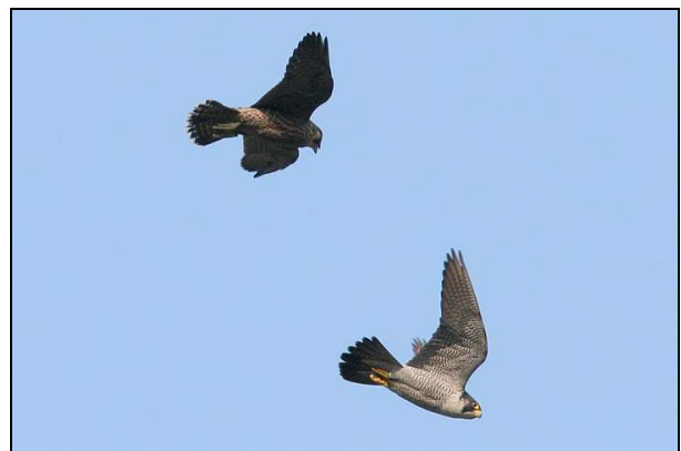
Boitsfort : Apprentissage en vol (adulte et jeune (en haut))

Bravo aux équipes respectives et merci à Stephan Peten pour les très belles photos !