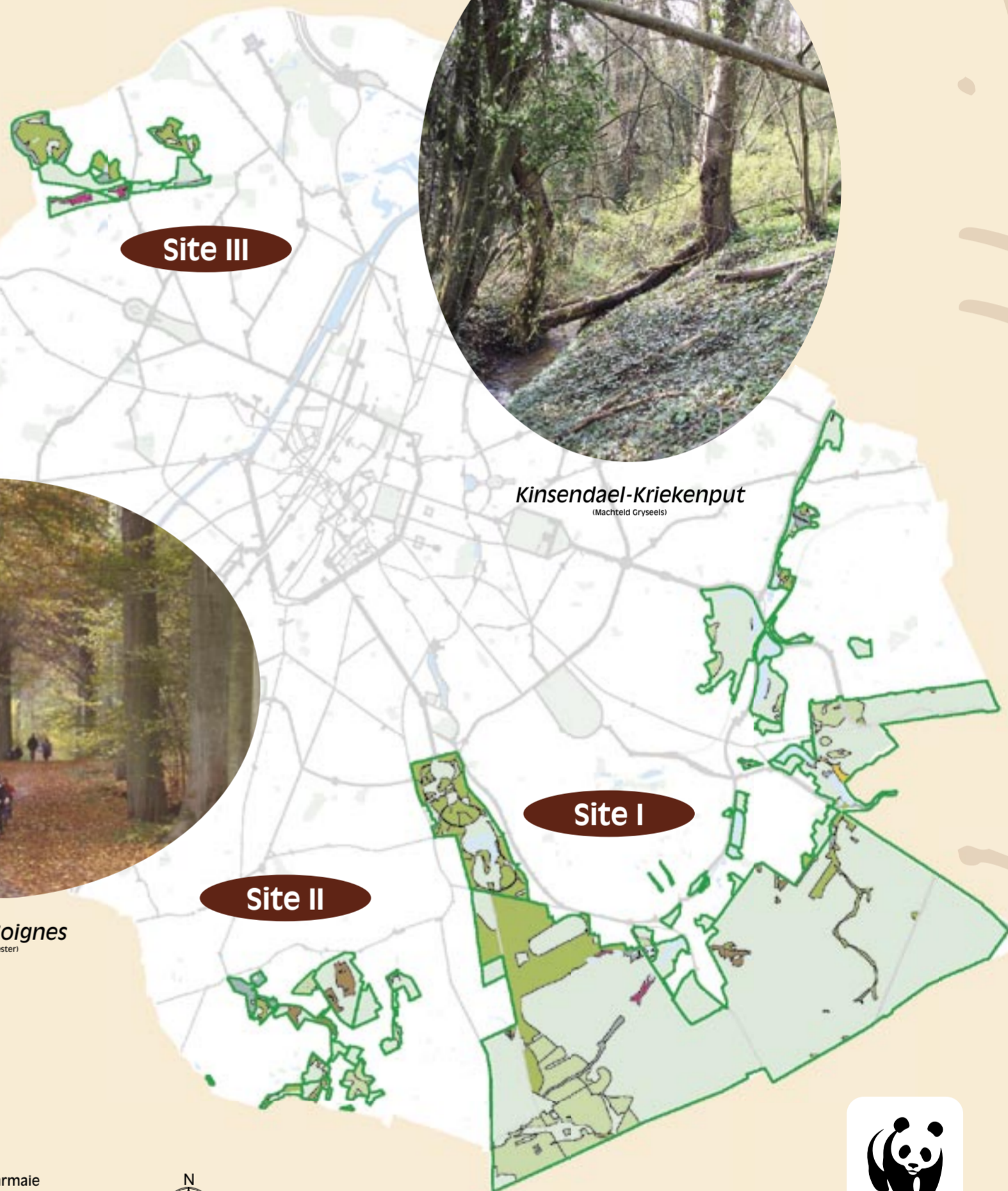
Kinsendaël-Kriekenput (Macrètel Gryseels)