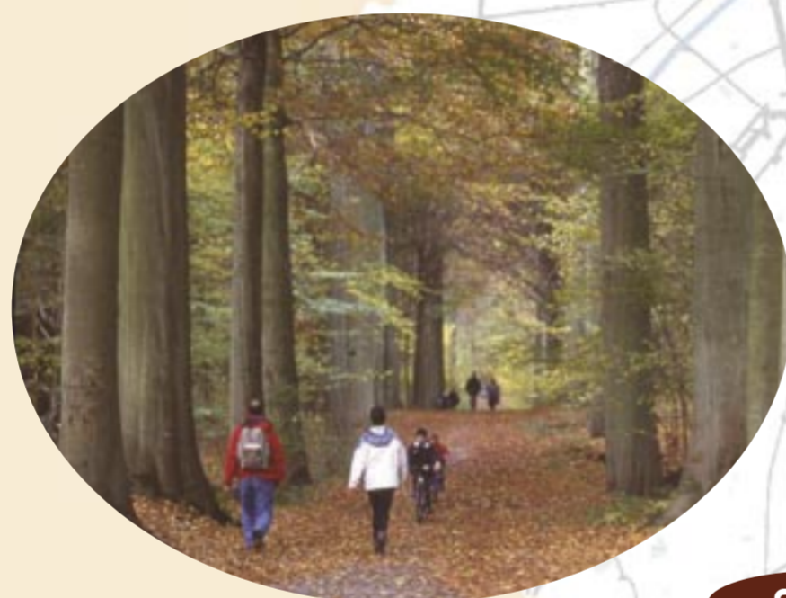
Forêt de Soignes (Johan De Meester)