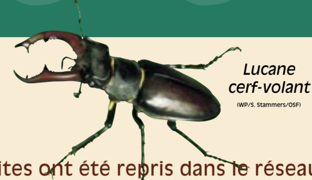
Lucane cerf-volant

de stations. Ces sites ont été repris dans le réseau Natura 2000 car essentiels à la conservation de 4 espèces de chauves-souris (sur un total de 17 espèces présentes), un insecte (Lucane cerf-volant) et un poisson (Bouvière), toutes ces espèces étant reprises à l'annexe II de la Directive Habitats, mais aussi pour la conservation de certains habitats (écosystèmes) repris à l'annexe I (voir carte et légende).