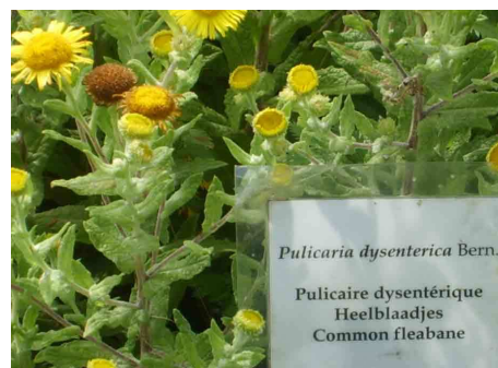
Pulicaria dysenterica Bern. Pulicaire dysentérique Heelblaadjes Common fleabane

Les promeneurs apprécient cet étiquetage.