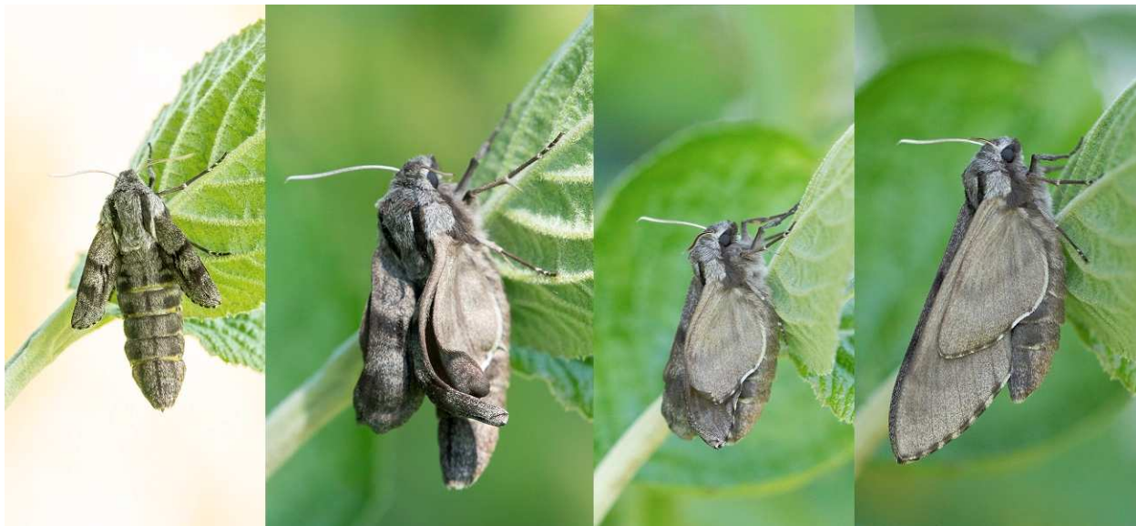
05/05/2018, Watermael-Boitsfort, Domaine des Silex

Outre les papillons habitués des lieux, notons la présence des chrysalides de Machaon dans la prairie fleurie ainsi que la découverte du Sphinx du Pin (5/05/2018).